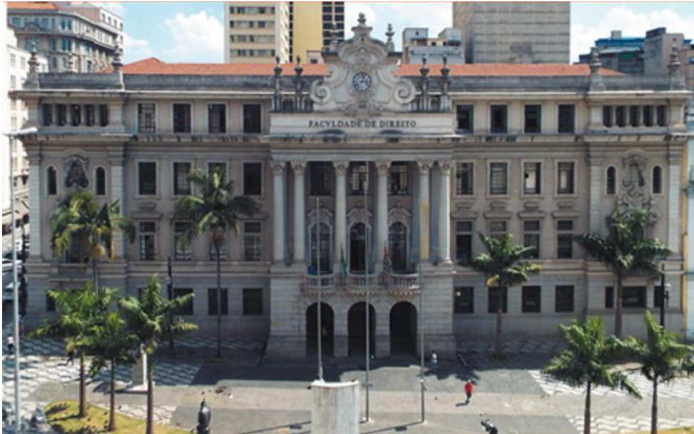
Imagem da Faculdade de direito da Universidade de São Paulo*

O I Congresso Científico da Comissão Nacional de Pesquisa do IBDFAM inaugura a participação efetiva de seus Membros como protagonistas da Pesquisa Científica do Instituto. O Congresso acontecerá nos dias 21 e 22 de novembro de 2024, na Faculdade de Direito da Universidade de São Paulo, auditório Rubino de Oliveira no 1º. andar do Prédio Histórico, no Largo do São Francisco, 95, Centro da Capital Paulistana.